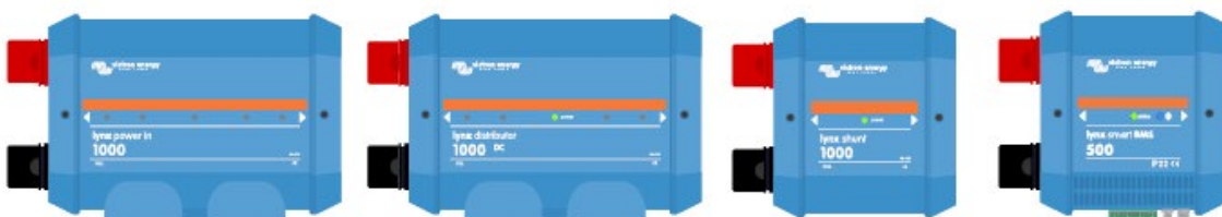
Los módulos Lynx: LynxPower In, distribuidor Lynx, Lynx Shunt VE.Can y Lynx Smart BMS