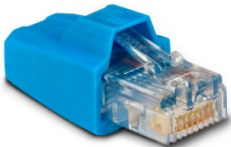
Conector RJ45 VE.Can

El Lynx Smart BMS se entrega con dos conectores VE.Can RJ45.