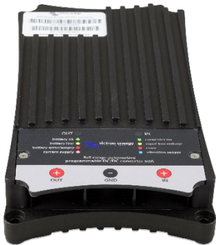
Indicador LED de salida