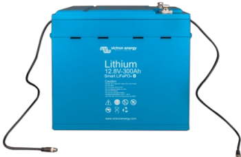
Batería LiFePO4 de 12,8V 300Ah

Muy útil para localizar un (posible) problema, como un desequilibrio de celdas.