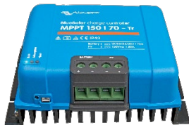
Controlador de carga solar MPPT 150/70-Tr