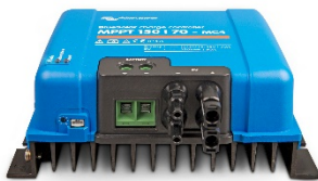
Controlador de carga solar MPPT 150/70-MC4