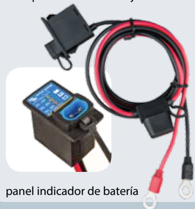
panel indicador de batería