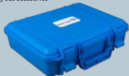
Malatín para cargadores Blue Smart IP65 y sus accesorios