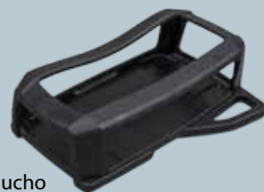
Soporte de pared