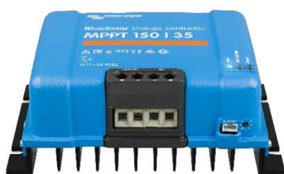
Controlador de carga solar MPPT 150/35