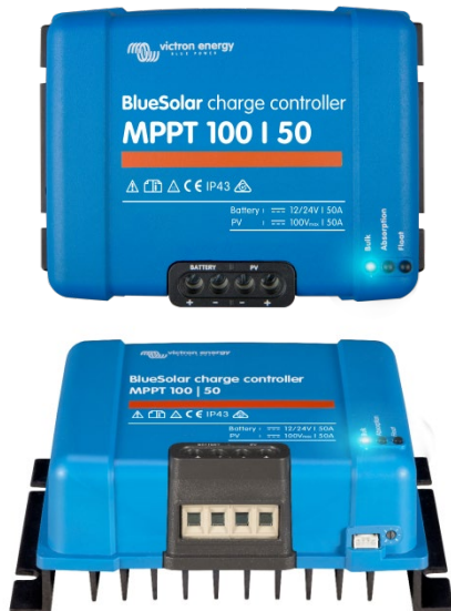
Controlador de carga solar MPPT 100/50