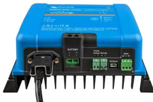
Phoenix Smart 12/50(1+1)