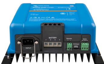
Phoenix Smart 12/50(3)