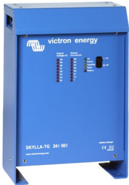
Cargador Skylla 24V 50A