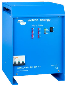
Skylla TG 24 50 3 phase

Para saberlo todo sobre las baterías, las configuraciones posibles y ejemplos de sistemas completos, pida nuestro libro gratuito "Energía Sin Límites" también disponible en www.victronenergy.com