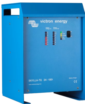
Skylla TG 24 100