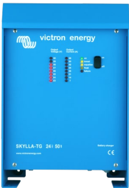
Skylla TG 24 50